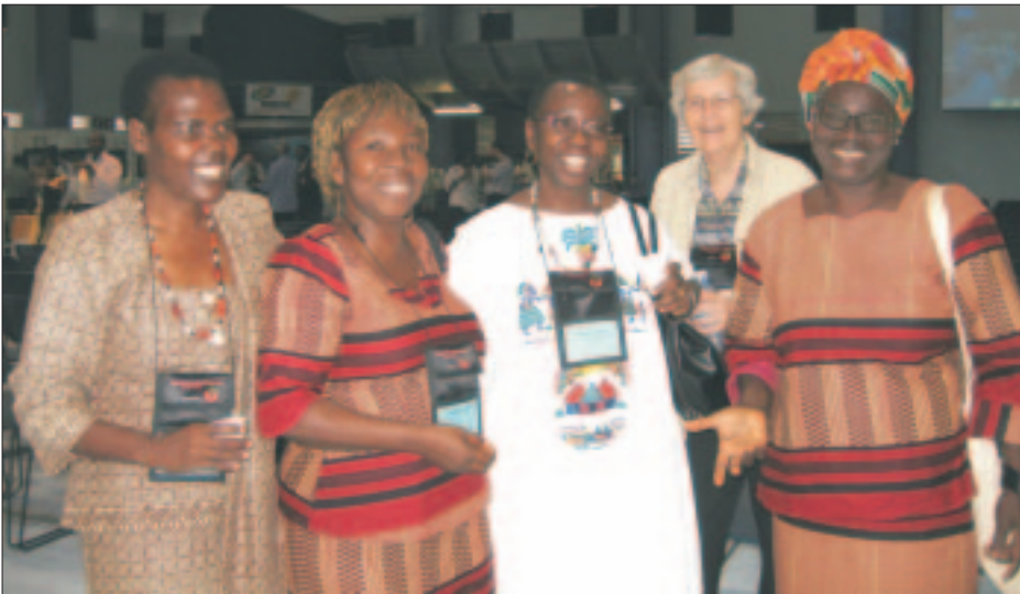
Les membres du Cercle a la 9eme Assemblée du Conseil Oecuménique des Eglises a Porto Alegre, Brésil:

africaine, christianisme, islam et judaïsme. Il comprend des femmes africaines et entretient des liens avec des femmes américaines, asiatiques ou européennes d'origine africaine. Elles sont en dialogue avec les cultures, les religions, les écritures sacrées et les histoires orales qui donnent une identité aux femmes du continent Africain.